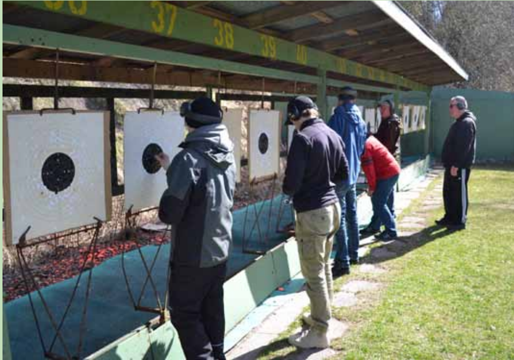
Muutaman kierroksen jälkeen paikkatarrojen väri vaihtui valkoisesta mustaan.