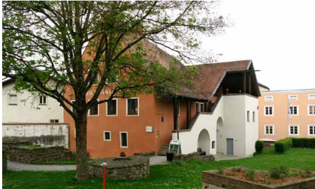
Museorakennus on 1300/1400 luvulla rakennettu entisen tulliaseman raunioille, kun kaupunki levittäytyi ja tämä osa sai lähes nykyisen muotonsa.

Museo on kolmessa kerroksessa ja alkuaankin pienen rakennuksen huonetiloissa. Tätä on käytetty aiheiden rajauksessa. Sisäti-