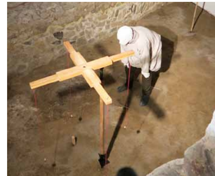
Museorakennuksen sisällä on kaivanto missä roomalaisen rakennusmestari edelleen uurastaa.