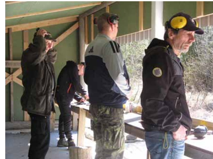
Kurssipäivän päätteeksi oli mahdollisuus kokeilla pistooliammuntaa.