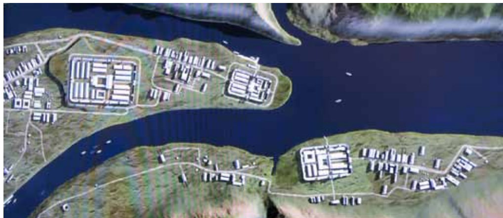
Vanhimmat varuskunnat Tonavan ja Inn'in yhtymäkohdassa. Laajin 'kasarmi' on ollut Rindermarktin ja Grabengassen kulmassa. Kaikkiaan varuskunnassa oli n. leijonnan/ prikaatin vahvuinen joukko-osasto. – Nykyinen museo on kuvan vasemmassa alakulmassa, tien varrella olevan pienen neliön (tulliasema) kohdalla.

koottu pienistä renkaista; todellista käsityötä. On myös yksi roomalaisten apujoukkojen värvätty sotilas täydessä asussaan – paikallisen väestön saamista mukaan imperiumin puolustamiseen on osattu käyttää