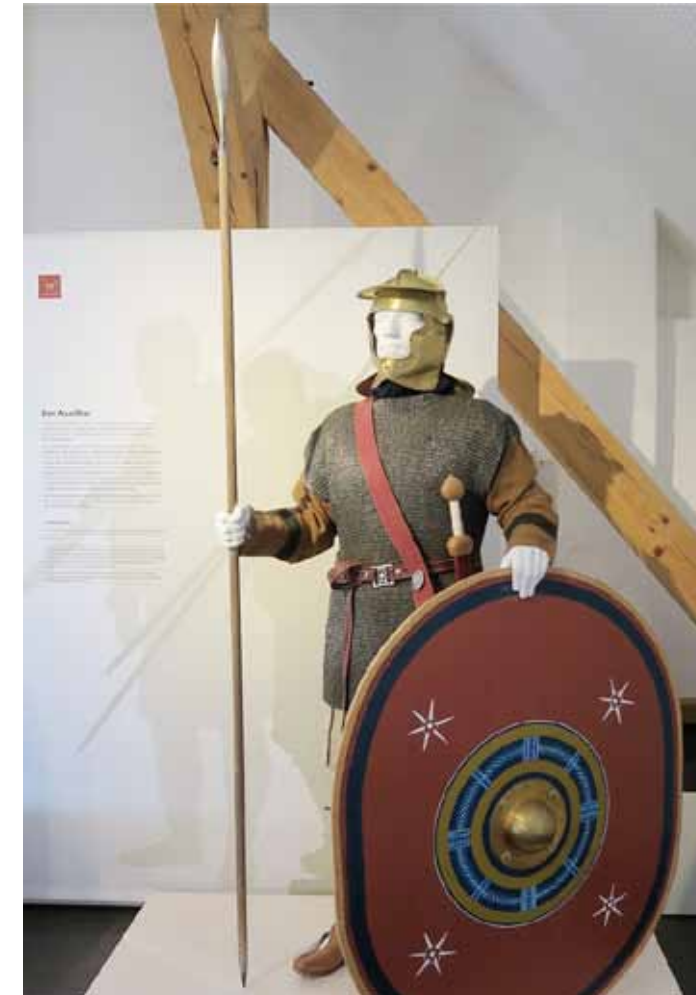
Rooman valtakunta värväsi paikallisia apujoukkoja syvän rajavyöhykkeen turvaamiseen.