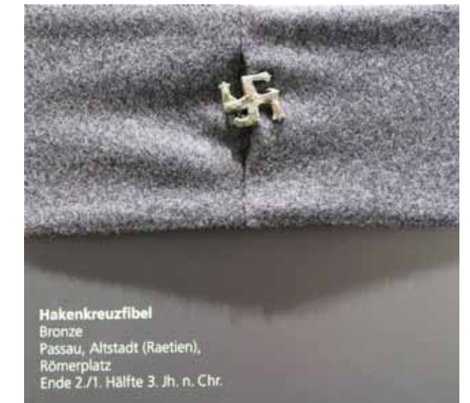
Ikivanha onnen symboli ... noin AD 350 ajan kaivauslöytö. Tätä ei siis keksitty 1930-luvulla!

RömerMuseum, Kastell Boiotro, Lederergasse 43-45, Innstadt, Passau. Avoinna: 1.3. – 15.11. Ti-Su 10.00 – 16.00