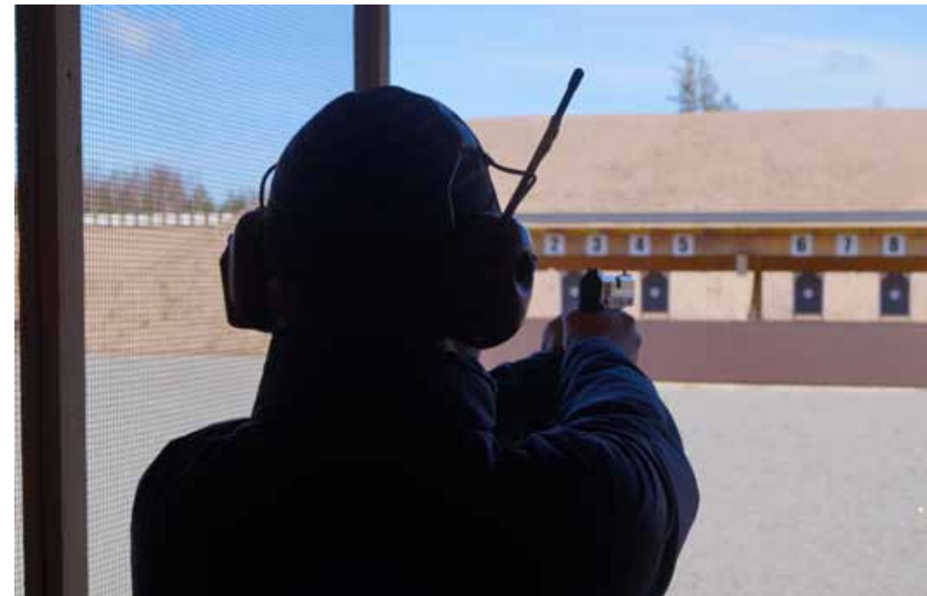
Pistooliradalla osallistujat saivat ampua lippaallisilla kertatuliaseilla ja revolverilla.