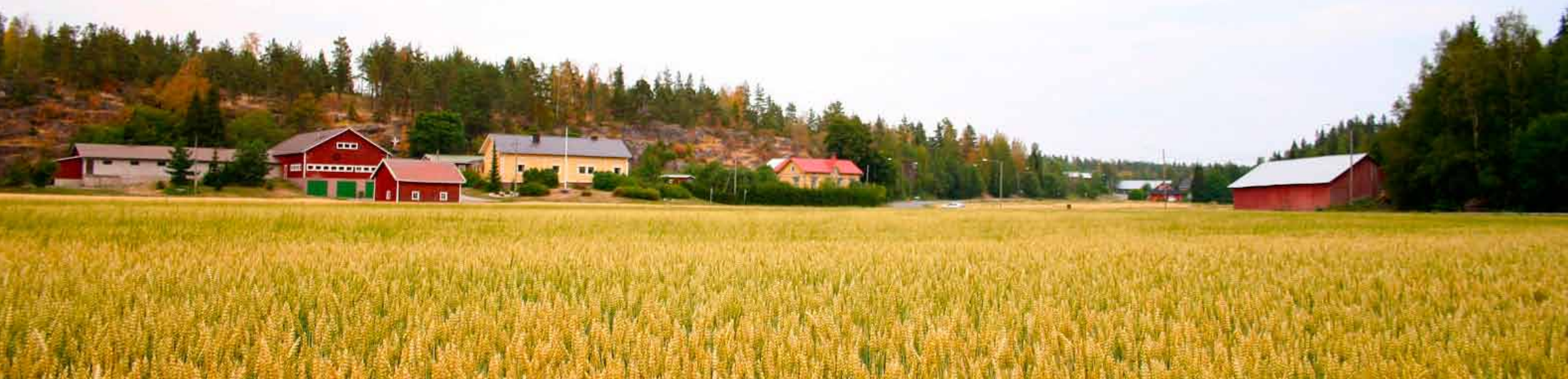
Klomppist piimä ko Sorkkam polkku -sanonta saattaa selvittää kuvan kaltaisissa maisemissa vaeltaville jotostelijoille.