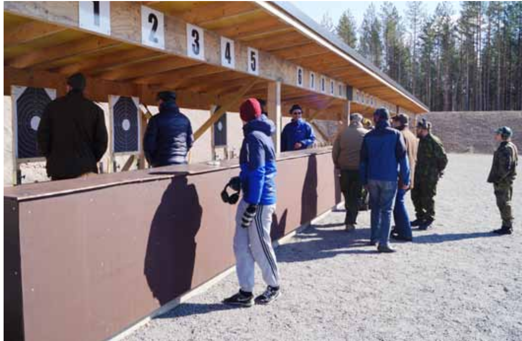
Kunnostetuilla ampumaradoilla oli mielekästä viettää päivää auringon paisteessa.

Sovellettu reserviläisammunta, eli SRA, on Reserviläisurheiluliiton kilpaurheilulaji, jossa suoritetaan ampumarasteja. Rasteilla on tyypillisesti liikkumista ja ampumista rajoittavia ja ohjaavia rakenteita. Rastisuorituksissa käytetään pääasiassa itselataavaa reserviläiskivääriä tai karbiinia, pistoolia, haulikkoja sekä tarkkuuskivääriä. Kilpailussa suorituksen pisteytys perustuu ampumataarkkuuteen ja rastin suoritukseen käytet-