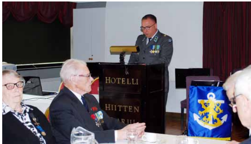
Majuri Lehtosen juhlapuheen sanomaa kuunneltiin tarkasti.