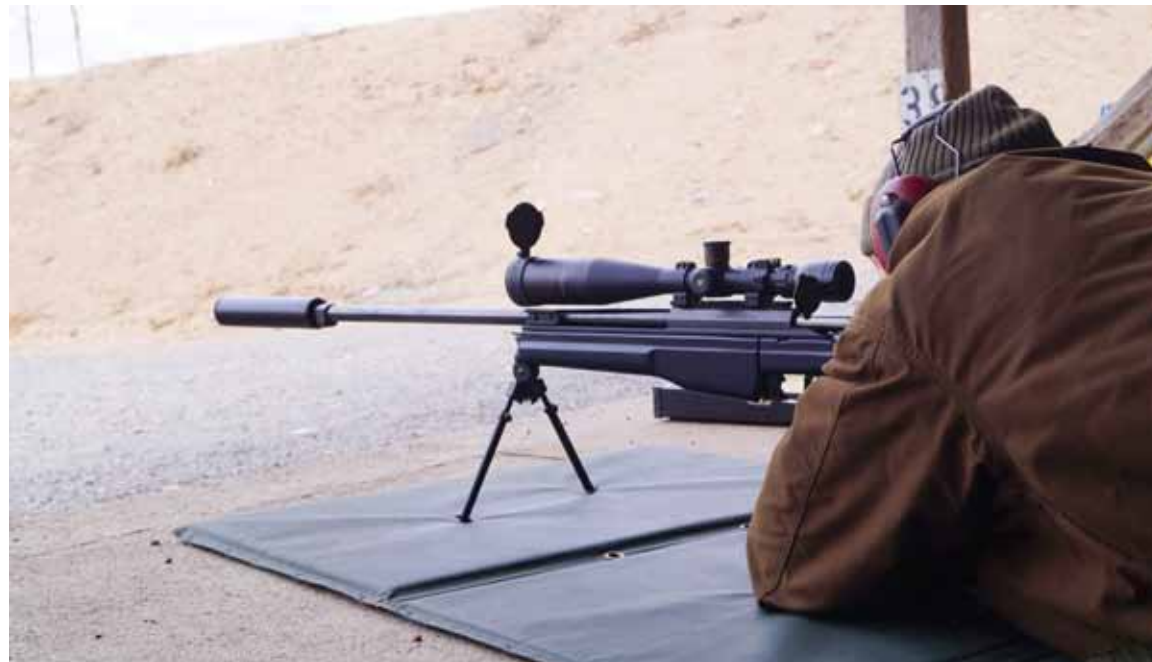
Ampumakalustoon kuului muun muassa Sakon TRG tarkkuuskivääri.