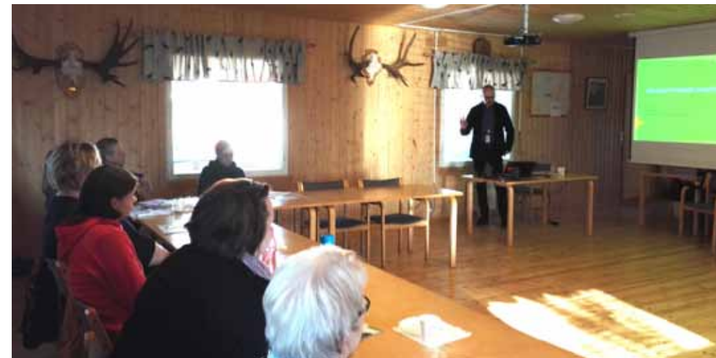
Pöytyän Riihikosken Riistatupa tarjosi hyvät puitteet keväiselle kurssille. Sähkönjakelun ongelmiin perehdyttiin leppoisassa ja vuorovaikutteisessa ilmapiirissä.