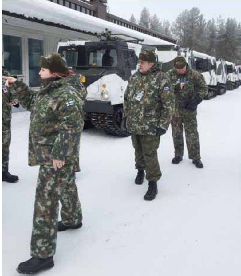
Tapahtuman osallistujat lähdössä tutustumaan arktisen sodankäynnin koulutukseen tela-ajoneuvoilla.