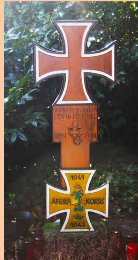
Rommel'n hauta löytyy paikalliselta hautausmaalta kävelymatkan päässä museosta.