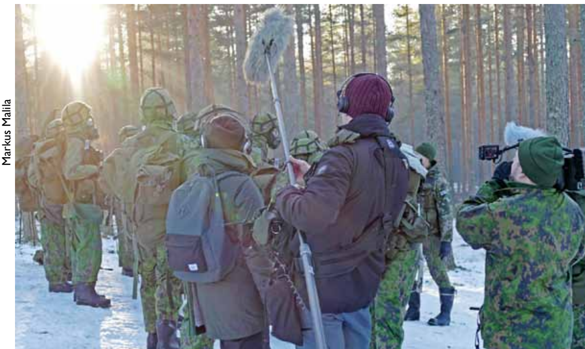
Kahdeksanosainen sarja naisten asepalveluksesta esitetään Yleisradion kanavilla alkuvuoden 2018 aikana.