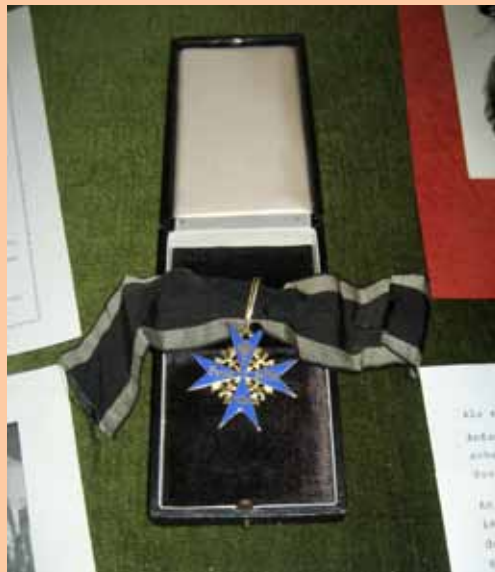
Esillä olivat myös Rommelille ensimmäisessä maailmansodassa myönnetty Pour le Merite -kunniamerkki sekä sotamarsalkan kuolinnaamio.

sa on vähintäänkin epäselvä, olivat vaihtoehdot vähissä. Oikeudenkäynti hirttäminen ja perheen lähettäminen keskitysleiriin tai