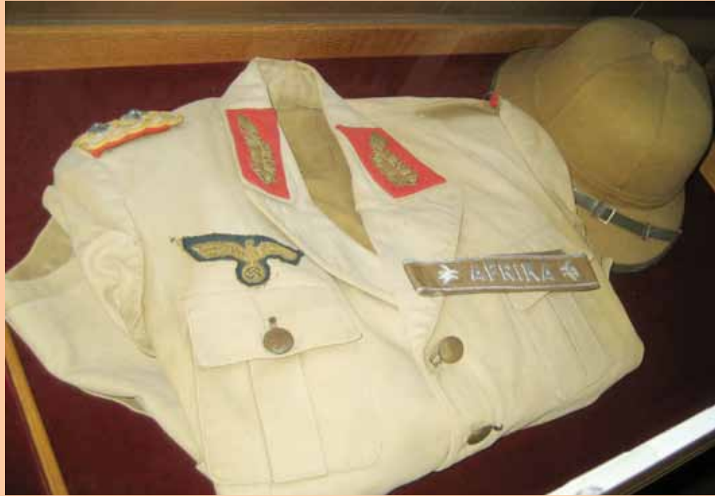
Erwin Rommelin Afrika Korpsin kenraalin asetakissa näkyvät käytön jäljet.

Selitimme, että olemme suomalaisia ase- ja sotahistorian harrastajia ja mieluisi tutustuisimme museon näyttelyesineisiin. Virkailija katsoi passimme, otti niistä valokopiot. Tiukan tutkistelun jälkeen hän päätti, ettemme ole uusia tai vanhoja aatteen kyllästämiä ja toivotti meidät tervetulleeksi. Lisäksi hän kertoi kunnioitetun sotamarsalkan haudan olevan paikallisella hautausmaalla aivan kävelymatkan päässä. Virkailija luovutti meille avaimet joilla pääsimme tiloihin sisään ja pyysi ilmoittautumaan, kun olimme tutustuneet riittävästi kokoelmiin. Museo koostuu kahdesta isosta huoneesta, joista pienemmässä olivat Rommelin ensimmäisen maailmansodan esineet mm Pour le Merite (Blauer Max) -kunniamerkki ja lukuisia asiakirjoja sekä valokuvia. Isommassa salissa ovat toisen maailmansodan esineet, joista varmasti yksi vaikuttavimmista on sotamarsalkan kuolinnaamio.