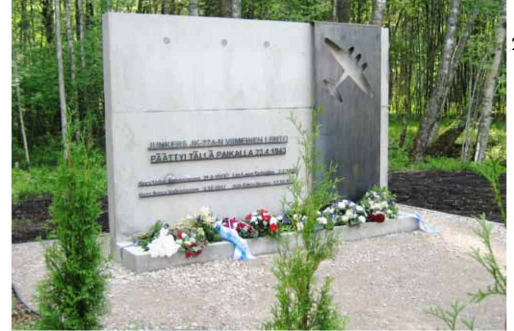
”Junkers JK-274:n viimeinen lento päättyi tällä paikalla 23.4.1943.”