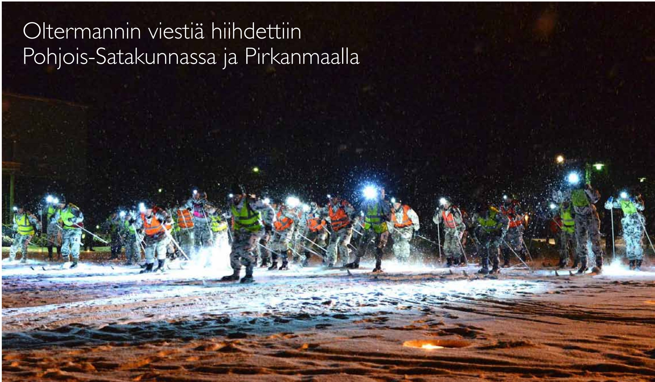
Tunnelma lähdössä oli kuin Lahden sprintissä.

Porin prikaati järjesti 8.-9. maaliskuuta Puolustusvoimien vanhimman urheilukilpailun, Oltermannin hiihdon, Pohjois-Satakunnan ja Pirkanmaan alueilla. Kilpailuun osallistui yhteensä 20 joukkuetta Maavoimista, Merivoimista, Maanpuolustuskorkeakoulusta, Puolustusvoimien logistiikkalaitokselta sekä reserviläispiireistä.