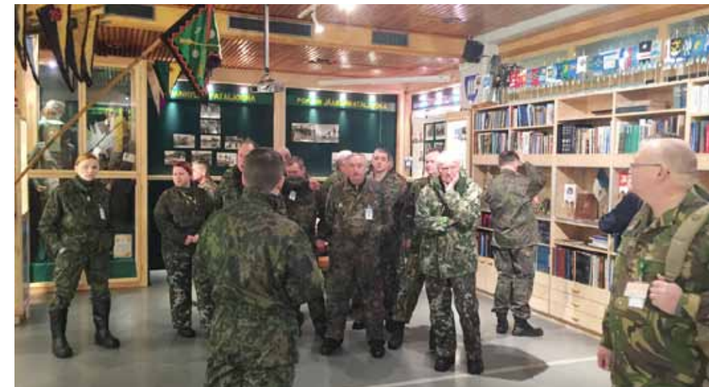
Jääkäriprikaatin museo kiinnosti vierailijoita.

Iltapäivällä oli vuorossa CISOR:in toimikuntien työkokouksia. Illaksi MPK:n toimijat olivat järjestäneet osallistujille kotillaan ja saunomista. Kodalla osallistujat pääsivät näkemään elävän poron, saivat maistaa kuivattua poron lihaa, ja osallistujat saivat lähteä saunomaan. Mieleenpainuvan illan kruunasi sauna, sekä vilvoittelut lumihangessa.