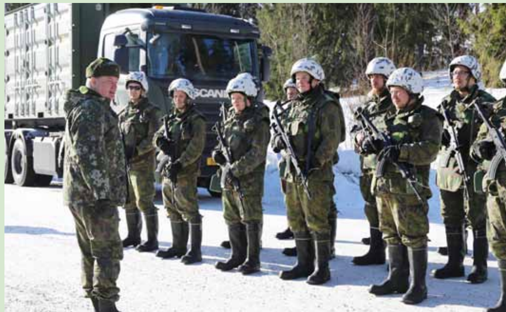
Tavoitteena on vahvistaa vapaaehtoisen maanpuolustuksen asemaa paikallispuolustuksessa sekä virka-aputehtävissä.

Puolustuselonteossa linjataan, että Maanpuolustuskoulutusyhdistystä kehitetään puolustusvoimien strategisena kumppanina pohjoismaisten toimintaperiaatteiden mukaisesti. Tavoitteena on vahvistaa vapaaehtoisen maanpuolustuksen asemaa paikallispuolustuksessa sekä virka-aputehtävissä. (RES)